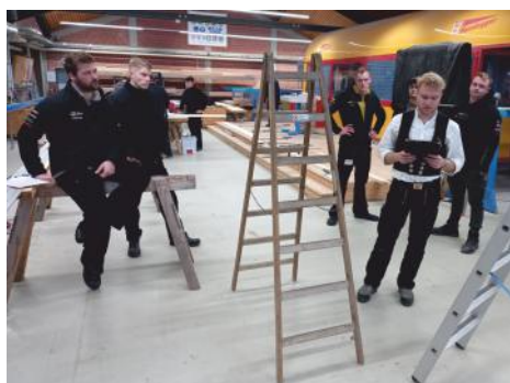
Wichtiger Seminar-Schwerpunkt: Qualifizierung „Befähigte Person zur Prüfung von Leitern/Tritten“

Erfolgreicher Abschluss des E-Learning-Angebots zur Absturzprävention der BG BAU www.bgbau.de/e-learning-absturzpraevention