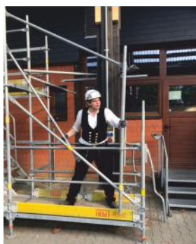
Gerüstbau mit integriertem vorlaufendem Seitenschutz